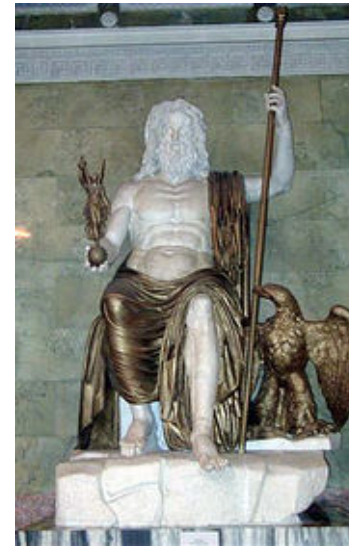
Reconstitucion de l'estatua criselefantina de Zeus olimpià.

L'estatua foguèt realitzada segon la tècnica criselefantina : de fuèlhas d'aur e de placas d'evòri que cobrisson una carpenta de fusta. Distinguissèm un agla a la drecha de Zeus, es un de sos atributs. Ten a la man la deessa de la victòria que lo nom es "Niké".