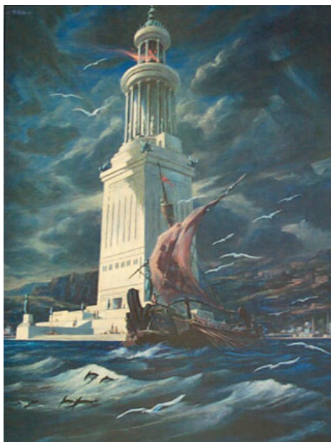
Le phare d'Alexandrie, tel qu'imaginé par un artiste du XVI e siècle.

Il était situé sur l'île de Pharos, dans le port d'Alexandrie. Il s'élevait sur trois niveaux, successivement à base carrée, octogonale et circulaire, et sa hauteur atteignait 134 mètres.