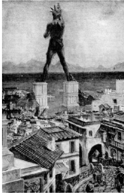
Une des reconstitutions possibles du Colosse de Rhodes

Le Colosse de Rhodes était une statue en bronze représentant le dieu grec Hélios, personnification du soleil. Elle mesurait plus de trente mètres, soit légèrement plus petite que la Statue de la Liberté à New York. Bâtie sur l'île de Rhodes vers l'an -292, cette gigantesque effigie fut renversée en -227 par un tremblement de terre qui toucha l'île de Rhodes. C'était la sixième des sept merveilles du monde antique.